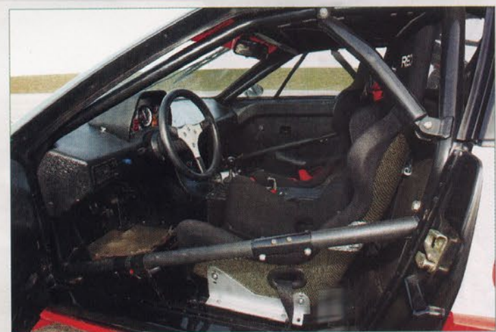
Très austère, l'intérieur ne comprend que le strict nécessaire. Cette économie permet de gagner près de 200 kg sur la version civile.

qui fait oublier tout le reste ! Je me souviens que, lorsque je disputais le Tour Auto 1983, je descendais de ma Lotus Elan au départ des spéciales pour mieux écouter la M1 de Bernard Béguin s'élancer au rupteur dans la montagne. Ce bruit devrait être classé au répertoire des Monuments Historiques !