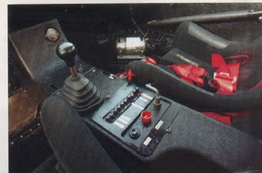
Outre le levier de vitesses, les contacteurs et fusibles des feux, ventilateurs et pompes sont placés sur la console centrale.