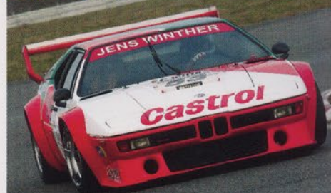
BMW M1 GROUPE 4