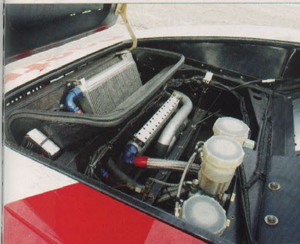
Sous le capot avant se logent les radiateurs d'eau et d'huile ainsi que les maîtres-cylindres de freins et d'embrayage.

ligne de 3497 cm 3 logé en position centrale arrière entre les tubes du châssis. Ce moteur est un monument, tant par ses dimensions que par ses caractéristiques. Sous le carter en magnésium typique de la Groupe 4 se cache une distribution à vingt-quatre soupapes entraînée par chaîne. L'alimentation s'effectue par des injecteurs logés dans les trompettes d'admission en plastique, commandés par un système Bosch Kugelfischer. Le dosage des gaz est commandé par une longue guillotine coulissante, actionnée directement par un câble depuis l'accélérateur. Cette fantastique mécanique fournit 470 chevaux à 8500 tours et un couple de 39 m.kg à 7000 t/mn. La boîte