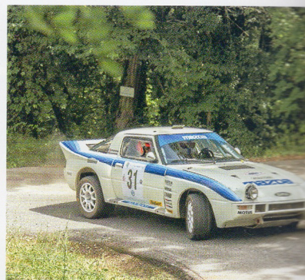
L'équipe SMG était présente avec deux Mazda RX-7, des autos peu communes qui ont plu aux spectateurs.

« Je vais travailler là-dessus activement, promet l'infatigable Yves. Je vais aussi revoir le découpage, réduire encore les liaisons, choisir les meilleures spéciales. Il y a tous les ingrédients pour que cela devienne la super-fête de l'asphalte, un pur plaisir pour les concurrents. Cette année, c'était une édition prototype, à nous de l'améliorer. » ■