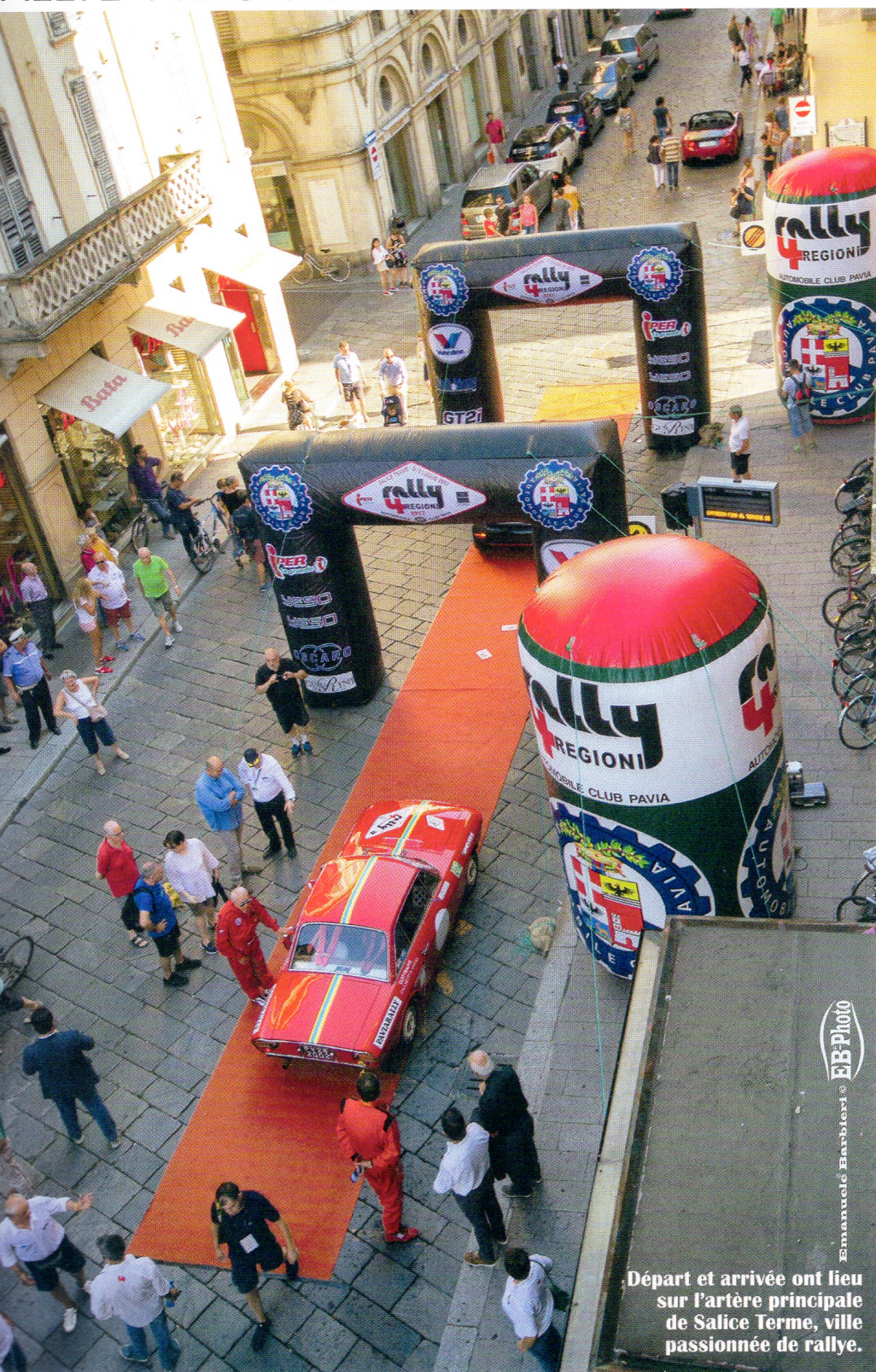
Départ et arrivée ont lieu sur l'artère principale de Salice Terme, ville passionnée de rallye.